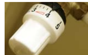
Bitte nicht zu warm! Überheizte Wohnungen können sogar gesundheitliche Folgen haben.