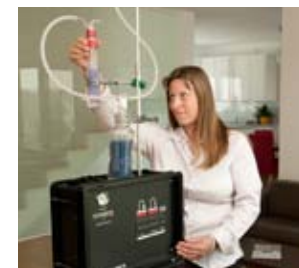
Professionelle Schadstoffmessungen geben Auskunft über die Konzentration von Schimmelpilzsporen in Ihrer Wohnung.

Schimmelpilzsporen sind Zeichen einer lebendigen Umwelt. Sie finden sich, wenn auch in unterschiedlicher Menge, praktisch überall in der Luft, so auch im Innenraum. Gesundheitsgefährdend werden Schimmelpilzsporen dann, wenn sich durch Feuchtigkeit die Möglichkeit zum Auskeimen ergibt.