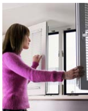
Regelmäßiges Stoßlüften ist besser als dauernd gekippte Fenster.

Richtiges Lüften hilft, für Wohlbefinden und Gesundheit zu sorgen. Es kann rechtzeitig verhindern, dass sich Luftverunreinigungen in Ihren Räumen ansammeln. In modernen Wohngebäuden gelten Komfortlüftungsanlagen als Standard. Diese vereinen die Zufuhr frischer Luft mit Wohlbehagen.