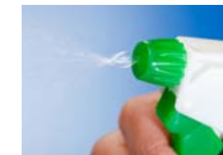
Vorsicht bei der Bekämpfung von Schimmelpilzbefall mit scharfen Chemikalien – diese sind oft selbst gesundheitsgefährdend!