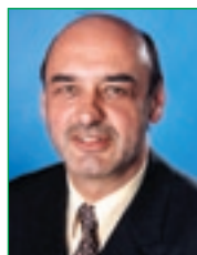
Manfred Wegscheider Umwelt-Landesrat Steiermark