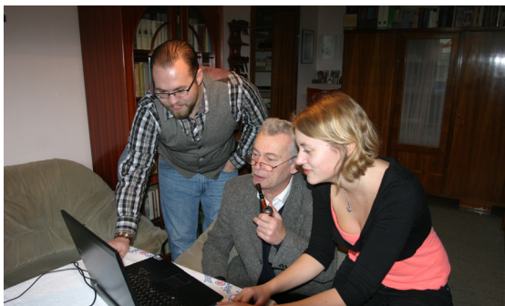
Ich helfe dir – du hilfst mir: Aufbau der Initiative Zeit-Hilfs-Netz Steiermark

In verschiedenen Arbeitsschritten und Vernetzungstreffen wurden die wichtigsten Eckpunkte im Bereich Versicherung, Datenbank, Unterstützungsangebote mit den Vertretern der Wirtschaft, den Gemeinden und den Regionalbetreuern der Landentwicklung konkretisiert, sodass eine erfolgreiche Umsetzung in den Kommunen der Steiermark im Jahr 2012 begonnen werden konnte. Bis 2013 nahmen acht steirische Gemeinden und Städte das Zeit-Hilfs-Netz in Anspruch und haben den Wert der Nachbarschaftshilfe und des praktischen Zeittausch-Systems erkannt. Ein steiermarkweites Zeit-Hilfs-Netzwerktreffen mit den Aktivbürgern der acht Gemeinden wurde von der Landentwicklung im Mai 2013 arrangiert.