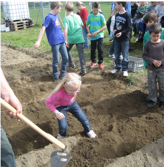
Schulgarten Gabersdorf/Bürgerbeteiligung fängt bereits in jungen Jahren an

Ein weiterer Schwerpunkt wurde in der Kooperation von Schulen und landwirtschaftlichen bzw. gewerblichen Betrieben im Ort durch Feldversuche gesetzt. 2012 hat man mit dem Jahresprojekt „Kürbis – vom Anbau bis zur Ernte“ einen Aktionsrahmen mit den Schulen gestartet.