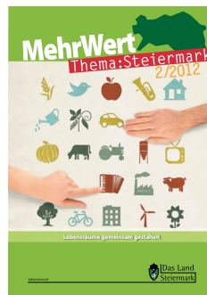
Cover des Magazins „Thema.Steiermark“, Ausgabe 2/2012

2012 startete die Landentwicklung Steiermark eine digitale Leserbefragung, an welcher rund 70 Personen teilgenommen haben. Insgesamt haben über 66 % der Befragten das Magazin gesamt mit der Note „Gut“ bewertet. An zweiter Stelle folgt „Sehr gut“ mit etwa 22 % sowie die Note „Befriedigend“ mit etwa 7 % und abschließend die Note „Genügend“ mit knapp 3 %.