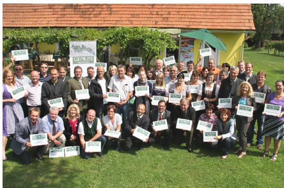
Mitglieder des Vereins „Genuss am Fluss“

2013 hat sich das Projekt mit zwei slowenischen Partnergemeinden erweitert.