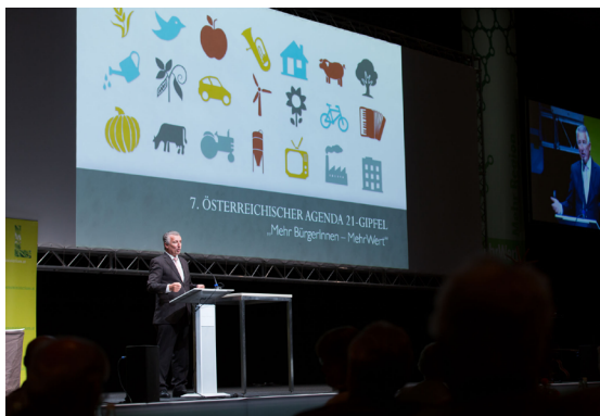
Vortrag von Bgm. Mödlhammer, Präsident des Österr. Gemeindebundes, im Rahmen des 7. LA21-Gipfels

Im Rahmen von Workshops, Vorträgen und Exkursionen war ein reger Austausch zu den verschiedenen Themen möglich und der Gipfel wurde mit einer Ausstellung innovativer Projekte als Ergebnis der Agenda-21-Prozesse aus allen Bundesländern ergänzt.