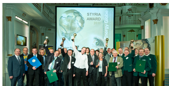
Alle Preisträger des Energy Globe Styria Award 2011