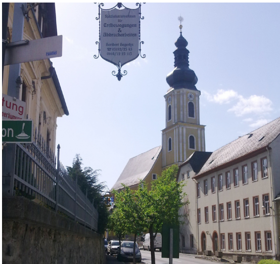
Historischer Ortskern von Wildon

Bewahrung des historischen Ortskerns aufgenommen wurde. Ein weiteres Thema beinhaltet die Radfahrfreundlichkeit der Marktgemeinde.