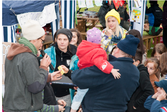
Verbindende Bürgerbeteiligung im Stadtteil Mürzbogen-Kapfenberg