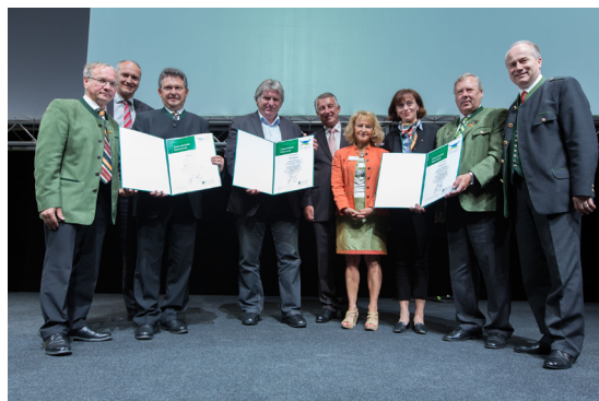
Neu ausgezeichnete LA21-Gemeinden

Stadt Bärnbach, Gemeinde Gabersdorf, Gemeinde Hohenbrugg-Weinberg, Gemeinde Johnsbach, Gemeinde Strallegg, Kleinregion Schladming.