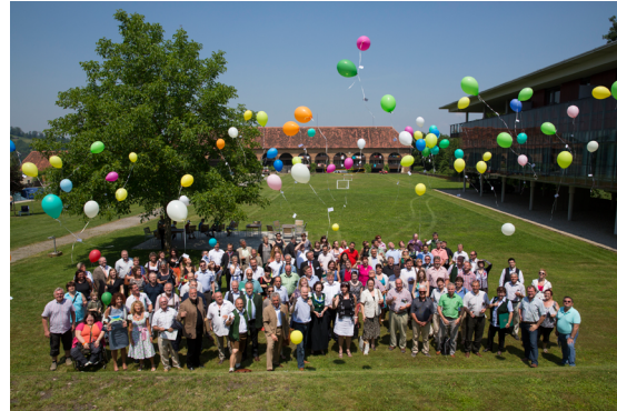
Teilnehmer des 13. Lokale-Agenda-21-Gemeindetages

Ausgezeichnet wurden die Kleinregionen Fehring und Mureck mit insgesamt zwölf Gemeinden sowie die Stadtteilagenda 21 in Kapfenberg. Erstmals wurden im Rahmen dieses Gemeindetages jene Personen mit einem Anerkennungspreis ausgezeichnet, die mit ihrem besonderen Engagement am Zeit-Hilfs-Netz Steiermark mitarbeiten.