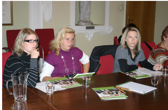
Bürger-Information zur Nahversorgung Vordernberg

Der Nahversorger fungiert gleichzeitig als Post Partner und bietet eine Kaffee-Ecke an. Die Neueröffnung des Bürger-Nahversorgers fand im Mai 2012 statt.