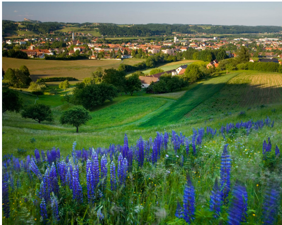
Herbstimpression aus dem südsteirischen Weinland