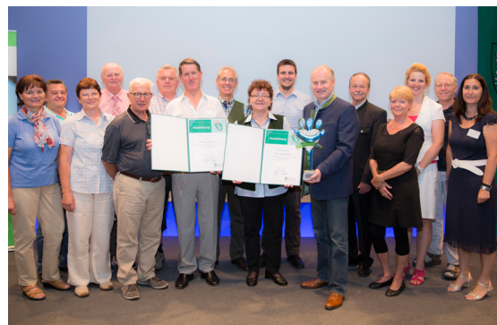
Senior Mobil mit Bahn und Bus