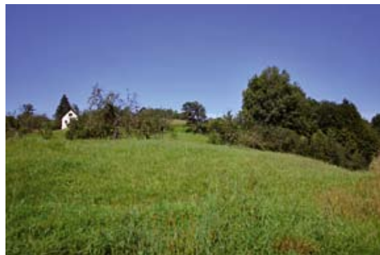
Abb 8: Artenreiche Glatthaferwiese mit kleinflächigen mager-trockenen Furchenschwingelrasen als geförderte ÖPUL-Naturschutzfläche.

mehreren Bundesländern eine Vereinfachung. Die Fördersätze werden vom Österreichischen Kuratorium für Landtechnik (ÖKL) kalkuliert. Österreichweit einheitlich kalkulierte Prämien gewährleisten somit bei 100%iger Ausfinanzierung einen einheitlichen Ausgleich für entstehende Bewirtschaftungsschwernis und Ertragsentgang.