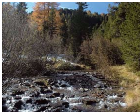
Abb 1: Der Kriterienkatalog dient zur Bewertung einzelner Fließgewässer im Anlassfall.

Näheres siehe unter www.verwaltung.steiermark.at/kriterienkatalog .