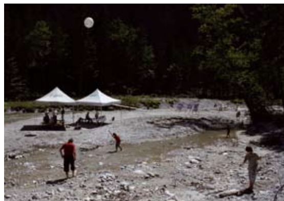
Abb 11: Die Renaturierung des Johnsbachs.

Die fünf Kilometer lange Nationalpark-Wildwasserstrecke, die in den 50er Jahren des vorigen Jahrhun-