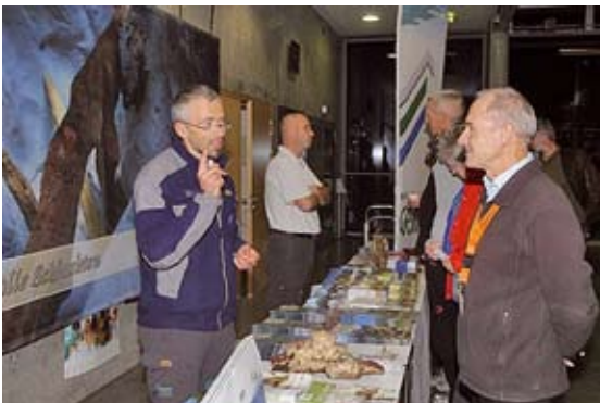
Abb 13: Der Infobereich des Nationalparks im Rahmen der Ferienmesse in Wien.