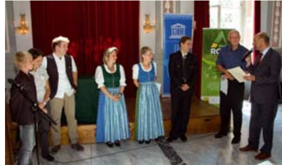
Abb 14: Die Partnerschaft zwischen dem Nationalpark Gesäuse und der Volksschule Hieflau sowie das Junior-Ranger-Programm wurden von der UNESCO als österreichische Dekadenprojekte ausgezeichnet.

In der Informationsflut, die uns moderne Medien bescheren, überwiegt oftmals das Negative. Natur kann hier ausgleichend auf die Seele wirken und uns Positives vermitteln. Wir dürfen uns erholen! Gleichzeitig hat sich unser Intellekt überproportional zu unseren immer noch vorhandenen archaischen Trieben entwickelt. Wir wollen immer noch jagen, elementare Ereignisse berühren uns emotional, wir sind fasziniert vom Feuer oder vom kühlen Nass eines Flusses, Kinder lieben es in der Erde zu graben – Erwachsene auch, aber sie erlauben es sich viel zu selten! Das strenge Korsett des zivilisierten Lebens lässt viele Bedürfnisse verkümmern. Naturverbundenheit kann als menschliches Grundbedürfnis gesehen werden – Naturentfremdung als oftmalige Krankheitsursache. Überwiegend künstliche Welten machen uns krank. Unsere Psyche braucht die Natur als Erholungsraum . Hier können wir auch philosophisches und spirituelles Denken wiederentdecken, das uns durch Berieselungsmechanismen moderner Medien und