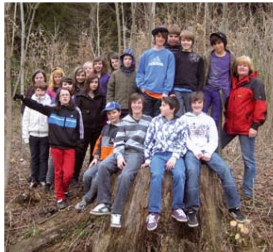
Abb 4: Die Schüler der HS Ilz, 2a Klasse.

Zielgruppen sind SchülerInnen aller Altersstufen und Erwachsene. Der Pfad soll kein Schilderwald mit langweiligen Tafeln werden, sondern neben der Informationsdarbietung auch ein Ort der Naturbegegnung mit Möglichkeiten zur Anregung, Entdeckung und spielerischer Erfahrung werden. Das Motto lautet: „Der Weg ist das Ziel“. Die SchülerInnen sind mit viel Freude und Engagement bei der Umsetzung des Projektes dabei. Die Fertigstellung des Keltischen Baumkreises erfolgte im Sommer 2009, die Umsetzung der anderen Themen ist für den Herbst 2009 geplant.