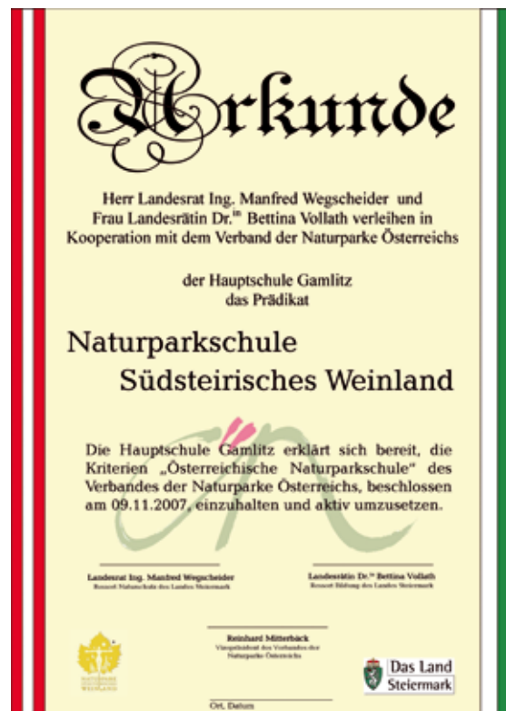
Abb 15: Auszeichnung als österreichische Naturparkschule.

Durch diese enge Kooperation mit den Naturparken nimmt die Naturparkschule einen ganz besonderen Stellenwert ein und kann sich als Bildungszentrum des Naturparks profilieren. Dies bedeutet eine wesentliche Aufwertung dieser Schulen – sowohl nach