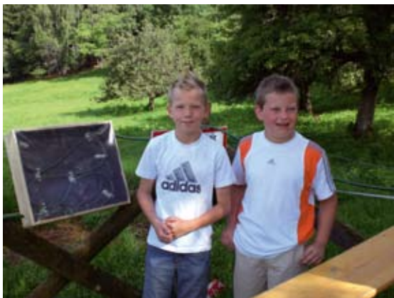
Abb 2: Schüler bei der Station „Sonnenkollektoren“ (VS Augraben).

Am 25.06.2008 wurden die Ergebnisse im Rahmen eines Aktionstages von den SchülerInnen in Semriach präsentiert.