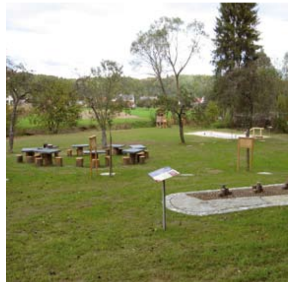
Abb 17: Freiluftklassenzimmer.

Auf Österreich-Ebene wird über den Verband der Naturparke Österreichs an einer Lernsoftware speziell für Volksschulen gearbeitet, die das spielerische Erfahren der Naturparke durch die Schüler fördern soll. Die Naturparkphilosophie soll bereits im Kindesalter vermittelt werden; die Lernsoftware bietet den Lehrerinnen und Lehrern der Naturparkschule eine einfache, bildliche Darstellung wesentlicher Merkmale aller österreichischen Naturparke. In weiterer Folge wird eine Onlineplattform zum österreichweiten Austausch von Informationen auf www.naturparke.at entstehen, die auch die Möglichkeit bietet, Projektideen und -ausführungen zu sammeln und Erfahrungen auszutauschen.