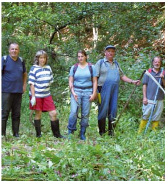
Abb 5: Eindämmung des Drüsigen Springkrautes.

nen sie natürlicherweise nicht vorkamen. Die Auswahl der Pflanzen zeigt bereits die Beweggründe für deren Transport – oft rund um den halben Globus. Der Erdapfel hat über viele Umwege den Weg in alle Küchen gefunden, während verschiedenste exotische Gewächse die Gärten und Parks der Pflanzenliebhaber schmücken. Der Einfluss und mögliche negative Auswirkungen der hier nicht eingeführten Pflanzen auf die heimische Flora sind vielfach nicht bekannt, somit können die damit verbundenen Gefahren oft nicht eingeschätzt werden. Als Beispiel sei hier das Drüsige Springkraut genannt. Viele Jahrzehnte – das Springkraut wurde 1839 nach England eingeführt und war bereits nach wenigen Jahren aus den Gärten ausgebrochen – hatte die (zugegebenermaßen sehr hübsche) Blume Zeit, unbemerkt und zunächst auch ohne Schaden für die heimische Pflanzenwelt, Neuland zu erobern. Erst vor einigen Jahren haben Biologen und Naturschützer die vom Springkraut ausgehende Gefahr erkannt und klären seither über die Auswirkungen auf Natur und Umwelt auf. Das Springkraut breitet sich über weite Gebiete durch mit Samen versetzten Flusssand am gesamten Flussverlauf aus. Auch Baumaschinen oder andere Geräte „infizieren“ bisher springkrautfreie Böden. Insbesondere Imker wissen längst, dass sich das Drüsige Springkraut nicht als Zierpflanze oder Bienenweide eignet und sind daher bereit, an Aktionen gegen die weitere Ausbreitung aktiv mitzuwirken. Daher wur-