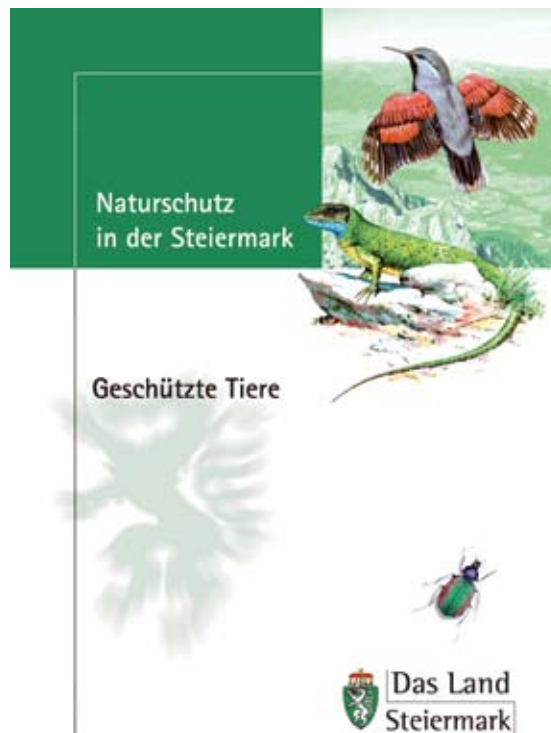
Abb 7: Informationsbroschüre der geschützten Tiere in der Steiermark.