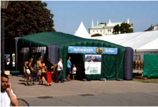
Abb 12: Die Präsentation der 3D-Schau „Die Zukunft ist wild“.

stätte", eines Infobereiches am Festgelände sowie kulinarischen Ständen der Nationalpark-Partnerbetriebe.