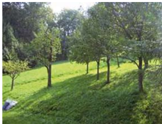
Abbildung 9: Nährstoffversorgte, an einen Wald grenzende Mäh-wiese als ÖPUL-Naturschutzfläche; Biotoptyp: Grünland frischer, nährstoffreicher Standort.