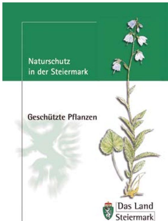
Abb 6: Informationsbroschüre der geschützten Pflanzen in der Steiermark.

mengedfasst. Die Broschüren sind unter http://www.verwaltung.steiermark.at/cms/ziel/2407390/DE/ zum Download freigegeben.