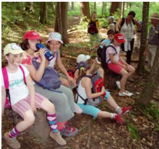
Abb 16: Waldspaziergang im Rahmen des Unterrichts der Naturparkschulen.

Weiters wurde im Rahmen eines steirischen Projektes die steirische „Naturpark-Schul-Mappe“ erarbeitet, die österreichweit eine Vorreiterrolle einnimmt und als Unterstützung für die PädagogInnen dienen soll. Diese Mappe ist in mehrere Rubriken unterteilt und bietet Informationen zum Thema Naturpark allgemein, aber auch detaillierte Auskünfte zu allen steirischen Naturparken. Weiters enthält die Mappe den Gesamtkatalog der für eine Naturparkschule zu erfüllenden Kriterien; sie bietet aber auch die Möglichkeit, Schulprojekte und Kontaktadressen zu sammeln und die Unterlagen um unterrichtsrelevante Materialien zu ergänzen.