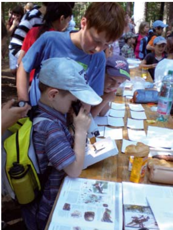
Abb 3: Die Ameisenstation (HS Semriach).

Für das Schuljahr 2008/2009 konnte die 2a Klasse der HS Ilz für ein Projekt im Sinne „Schule auf dem Weg nach draußen“ gewonnen werden. Die SchülerInnen erweitern den bestehenden Naturlehrpfad mit folgenden Themen: