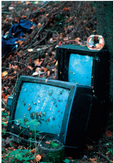
Reparieren statt wegwerfen.

D as Land Steiermark und die Wirtschaftskammer Steiermark bekennen sich zum Prinzip der Nachhaltigkeit. Wir verstehen darunter eine Entwicklung, die den Bedürfnissen der heutigen Generation