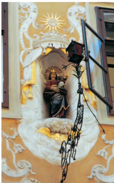
In einer Altstadt gibt es immer etwas zu renovieren und damit zu erhalten.