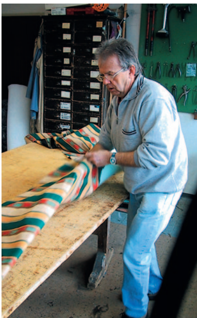
Vom Sitzbezug einer Eckbank bis zur lädierten Jalousie: Repariert wird, was noch lange nicht zum alten Eisen gehören sollte.