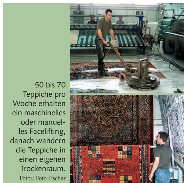
50 bis 70 Teppiche pro Woche erhalten ein maschinelles oder manuelles Facelifting, danach wandern die Teppiche in einen eigenen Trockenraum.

Bei Restaurierungen wird grundsätzlich zuerst ein Kostenvoranschlag erstellt, der sich im Wesentlichen nach der notwendigen Arbeitszeit richtet. Mit den Arbeiten wird erst nach dem OK des Kunden begonnen. Für alle gilt jedoch der Tipp, selbst kleinste Defekte an einem Teppich umgehend reparieren zu lassen, um später höhere Instandsetzungskosten zu ersparen.