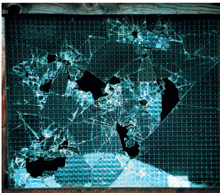
Der Ball segelt in hohem Bogen durch den Garten und ...

Neben der Wiederinstandsetzung bieten die Glaser aber auch Maßanfertigungen, beispielsweise bei Schau- fenstern, Couchtischen, Spiegeln oder Türverglasungen.