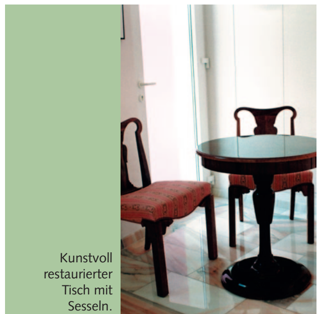
Kunstvoll restaurierter Tisch mit Sesseln.