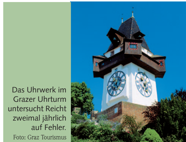
Das Uhrwerk im Grazer Uhrturm untersucht Reicht zweimal jährlich auf Fehler.